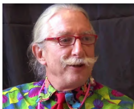
DR HUNTER PATCH ADAMS

Immortalisé au cinéma par Robin Williams, ce médecin inspira des millions de personnes en intégrant le rire et le plaisir dans les hôpitaux. Pour lui, la « guérison repose sur un échange humain, pas sur un acte commercial ». Il est le fondateur et directeur d'une institution de santé qui a fourni des soins médicaux gratuits à des milliers de patients depuis 1971. Patch Adams continue de rêver à cet hôpital «heureux et drôle» qu'il aimerait gratuit.